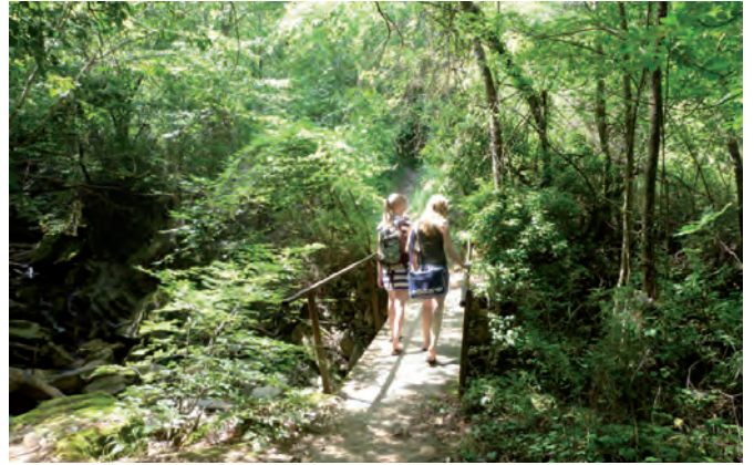
7. über eine schmale Eisenbrücke