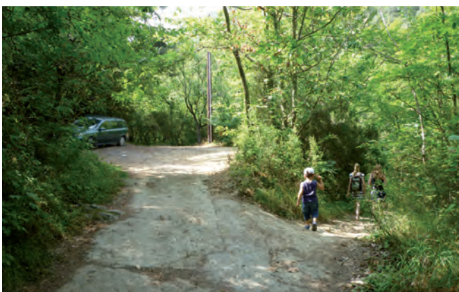
6. kurz vor einem Platz, rechts runter