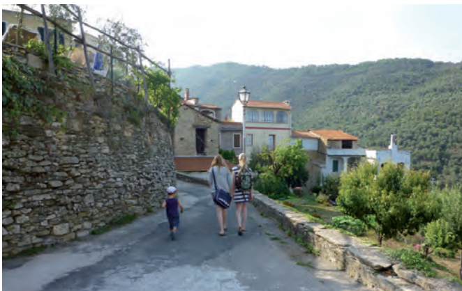
1. Los geht's