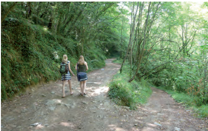
5. immer oben auf dem Hauptweg