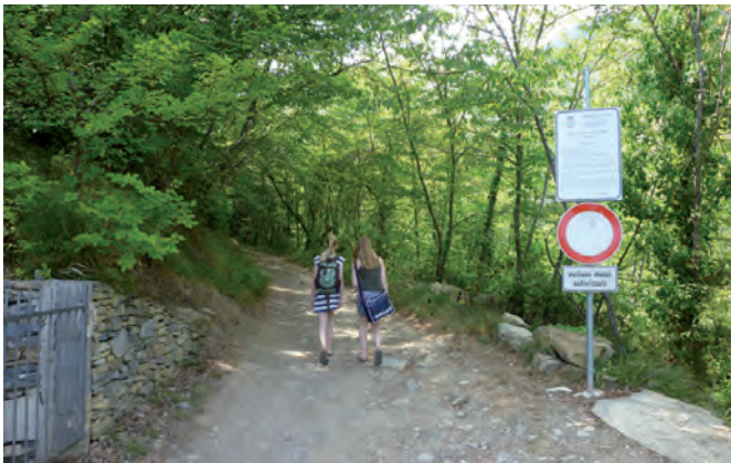
4. geradeaus in den Wald rein