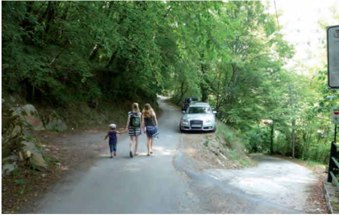
3. nach rechts geht zur Kirche Acquasanta, Sie bleiben oben auf der Straße