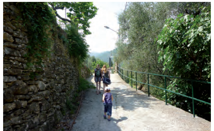
2. immer geradeaus