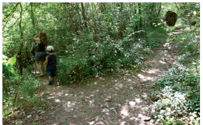
8. 50 Meter hoch und dann links in einen Trampelpfad